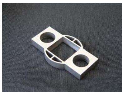
Präzisionsschneidteil 1.4301, t=4mm