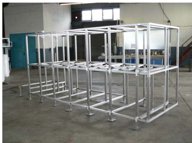
Sondergestell aus Edelstahl 1.4571